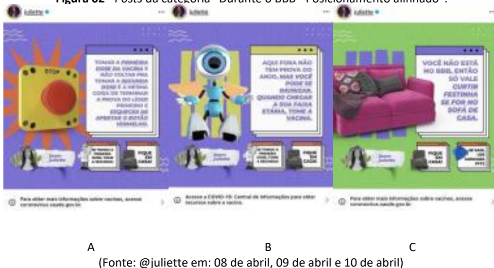
Figura 02 - Posts da categoria “Durante o BBB - Posicionamento alinhado”.

O post ilustrado na figura 02A faz uma alusão à prova do anjo, brincando com o termo “imunização” que, no contexto, passa a ter dois sentidos. Se fazem presentes na imagem as estratégias de informação e posicionamento , consecutivamente, instruindo sobre a importância da vacinação e comunicando o apoio da participante na imunização coletiva e, também as estratégias de visibilidade , dado que, com o reconhecimento da participante na mídia, é possível alcançar um grande público; legitimidade para reforçar o posicionamento alinhado com Juliette; e valorização pois, de acordo com Gabriel e Kiso (2020, p. 240), “nós populares tendem a ser mais influentes na rede”, assim, a participante seria vista como