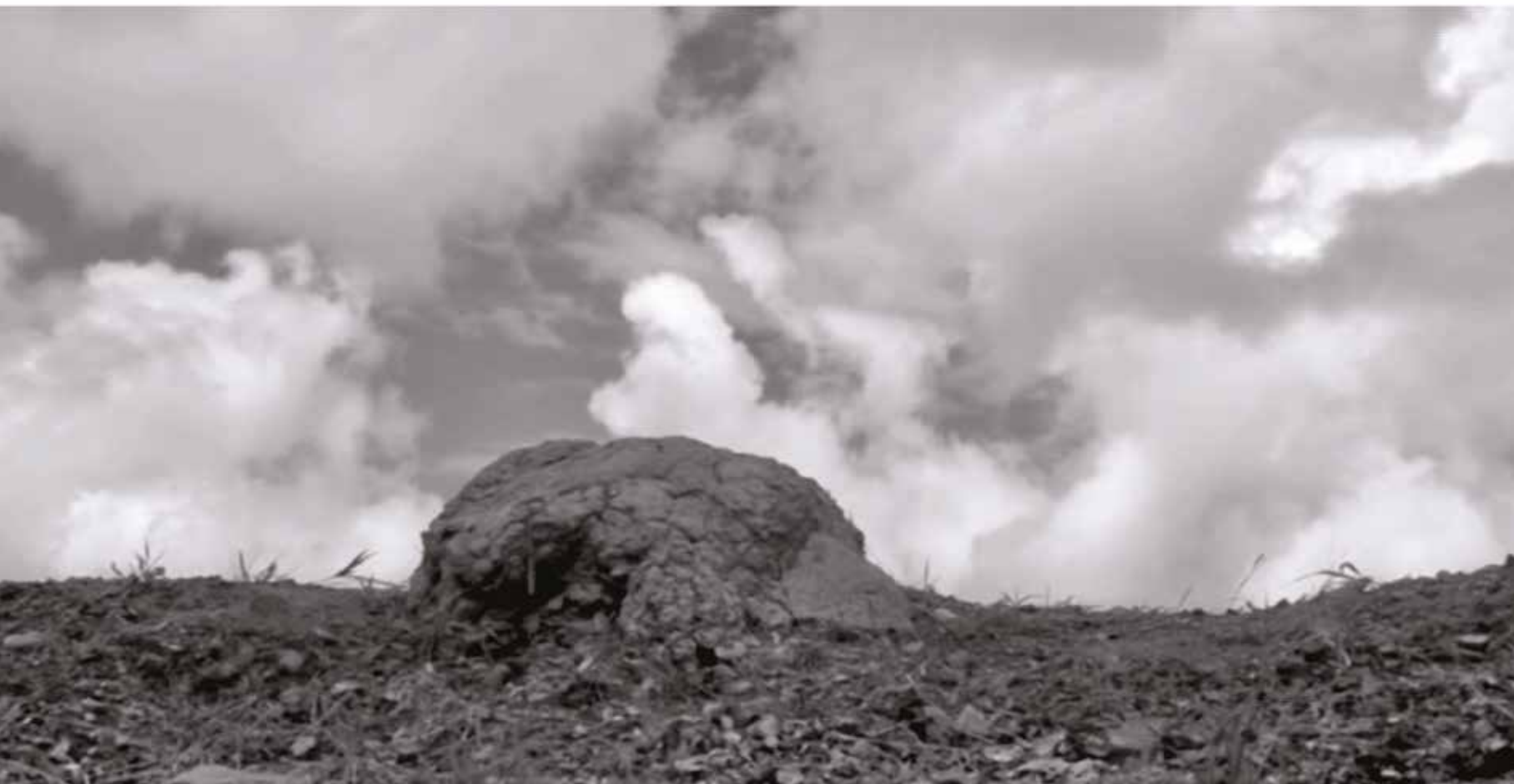
Fig. 05_Coisas da ilha.