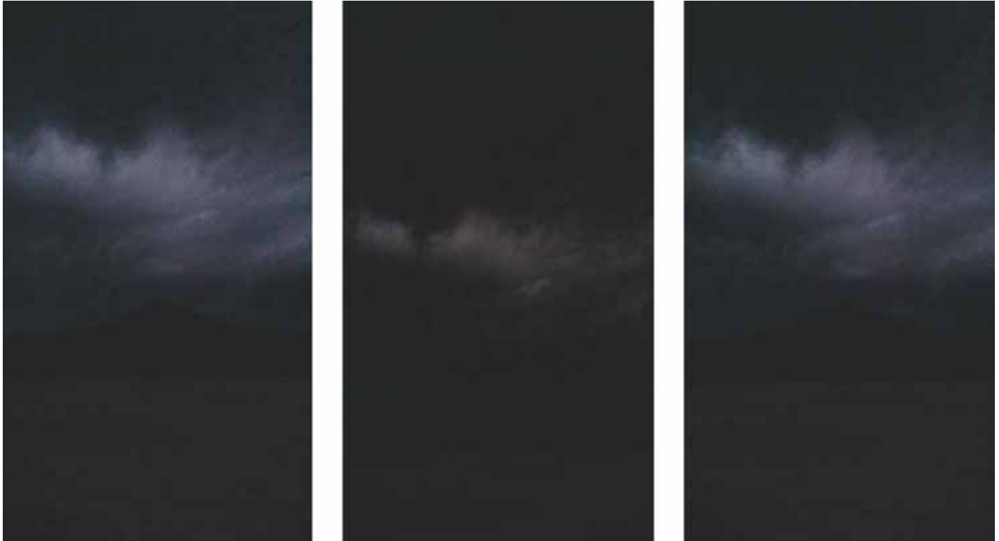
Fig. 02_Coisas da ilha.