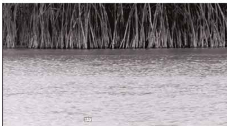
Fig. 01_Coisas da ilha.