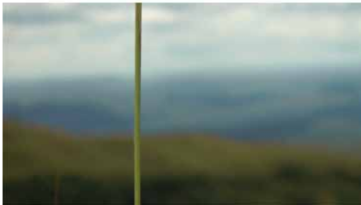
Fig. 03_Coisas da ilha.