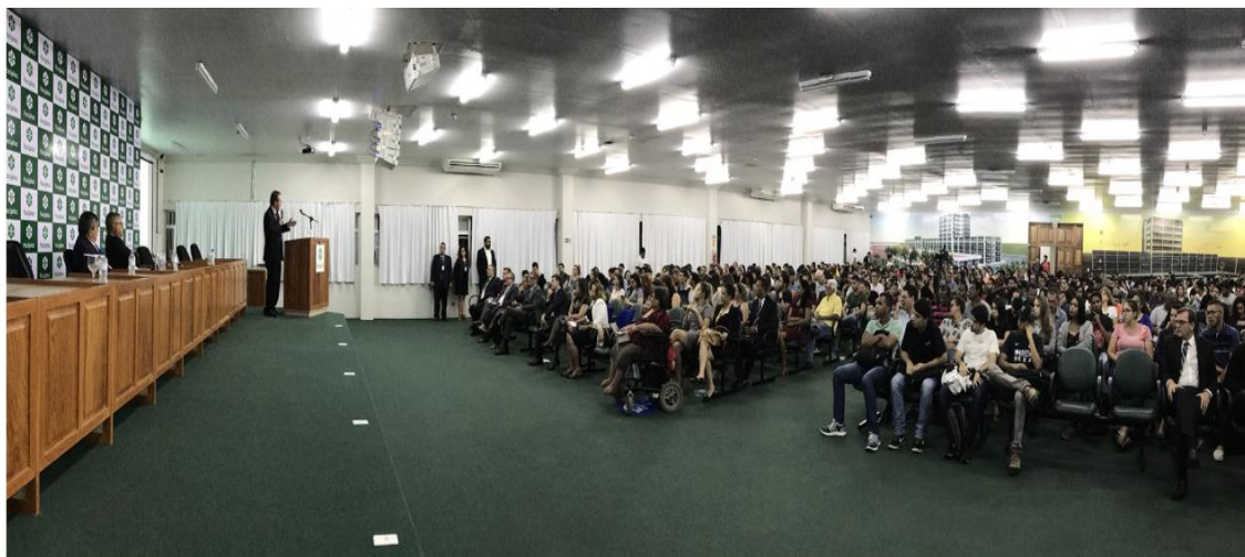
(Seminário Internacional realizado na Faculdade Faciplac/DF, sobre Terceiro Setor e Previdência para aproximadamente 1100 estudantes).

Houve a realização de aproximadamente 40 (quarenta) seminários, 8 (oito) colóquios, parcerias com a Fundação Banco do Brasil, Fundação Paiva Neto, Legião Brasileira da Boa Vontade, Associação Nacional de Servidores da Previdência e Seguridade (ANASPS), Associação Nacional de Promotores de Fundações (PROFIS) e aprovação com nota máxima no programa PROEXT de 2015.