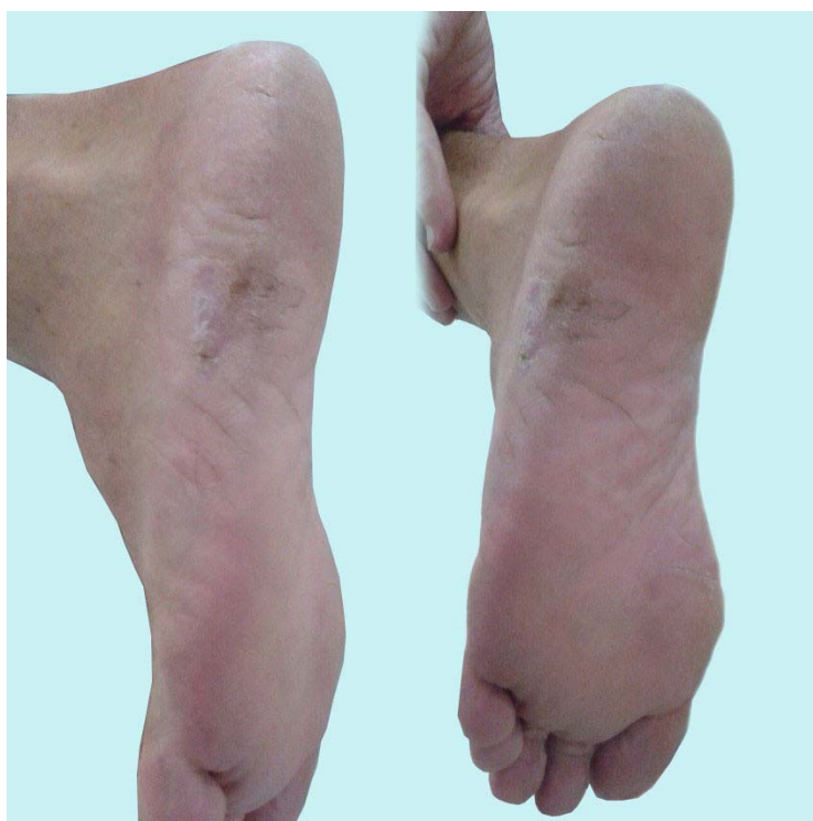
Figura 2 –Líquen plano plantar. Placa eritemato-descamativa no pé esquerdo.