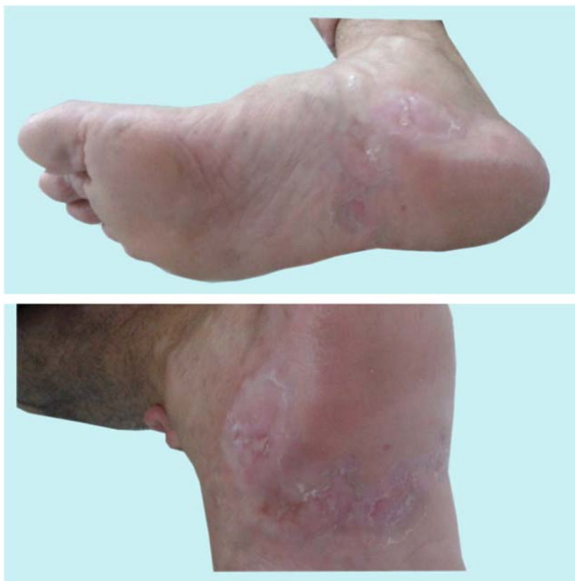
Figura 1 – Líquen plano plantar. Placa eritemato-descamativa no cavo plantar direito.